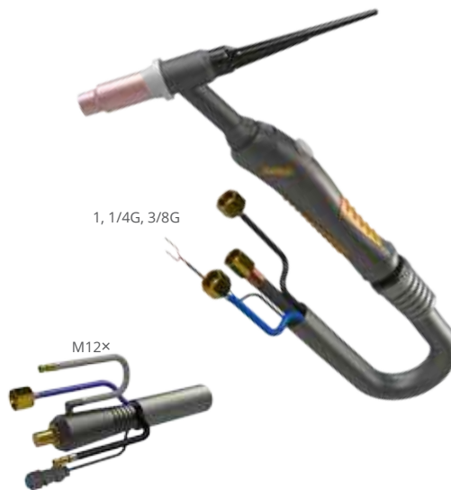
1, 1/4G, 3/8G